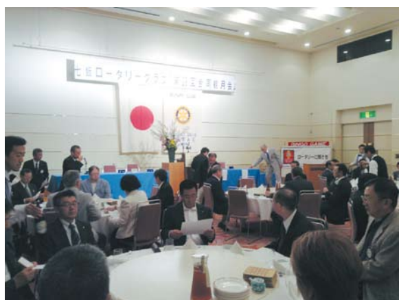
9月9日(火) 七飯ロータリークラブ の観月例会へ4名で 参加致しました。