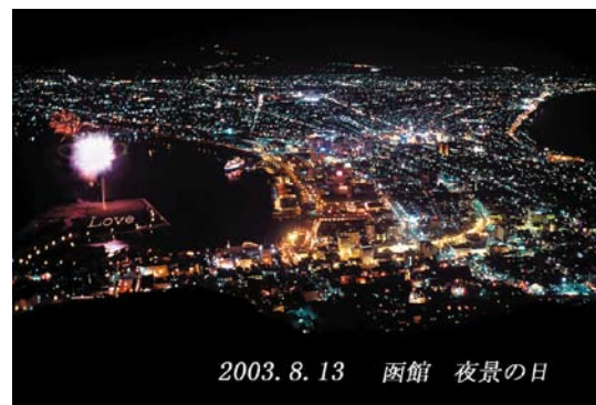
2003. 8. 13 函館 夜景の日

3、15日函館亀田RC、18日函館RC、24日函館北RC、25日函館RC、26日函館五稜郭RC例会は夫々変更しております。