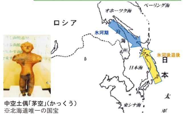
中空土偶「茅空」(かっくう) ※北海道唯一の国宝