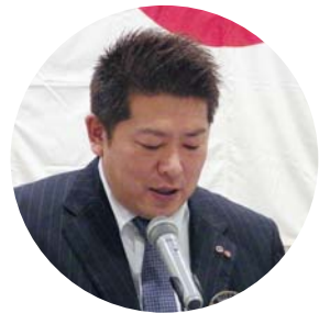
副幹事 安保 会員