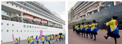
クルーズサポータークラブ「見送り隊」 道産高校の生徒によるエスニックな見送り

デッキ上の乗客・乗員と一体感を持った独特の見送り 軽快なリズムに乗った踊りは, 誰でも簡単に覚えられる