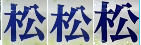
デジカメ 設定 (大) デジカメ 設定 (小) iPhone12 メール送信